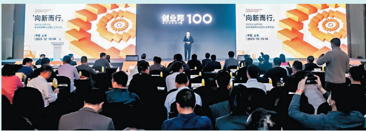
創業邦發布100未來獨角獸榜單。