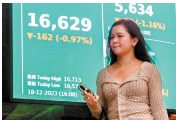
◆港股昨跌162點，成交縮減至943億元。

恒指昨收16,629點，跌162點或1%，大市成交縮減至943億元。科指收報3,730點，跌約1%。信義光能（0968）及中國生物製藥（1177）挫逾5%，成表現最差兩隻藍籌。紅海危機下，憧憬貨櫃船費向上，部分航運股急升，海豐國際（1308）升逾14%，中遠海能（1138）、中遠海控（1919）升逾6%及逾7%，東方海外國際（0316）升4%，成表現最佳藍籌。