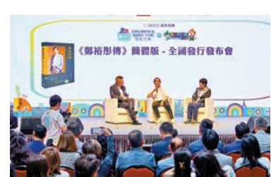
《鄭裕彤傳》簡體版全國發行發布會。

香港文匯報訊（記者 胡茜）第四屆「兒童書展暨超級親子用品展」（兒童書展）早前在香港亞洲國際博覽館舉行，是次展會以「兒童中外文化藝術交流世界」為主題，設置超過700個攤位，涵蓋「兒童教育」、「嬰幼兒專區」、「親子百貨」及「親子活動」四大範疇。