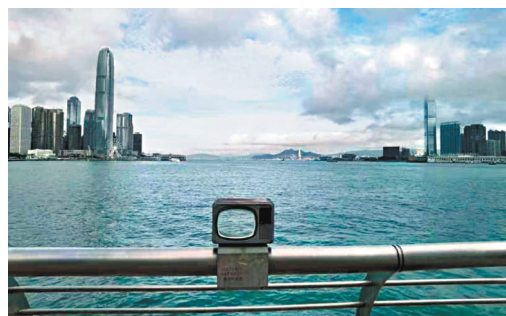
◆《「港」電視·講「家」情》

隨着中央與特區的關係全面走上正軌，建制派與反對派的關係也一攬子解決了。香港的政治生態歷來複雜，由於特殊的移民歷史和社會發展進程，形成了建制派、中間派、反對派三大政治勢力。多年來，他們在香港政治舞台上縱橫捭闔，攻城掠地，背後其實反映着中國、英國、美國之間的大國博弈。