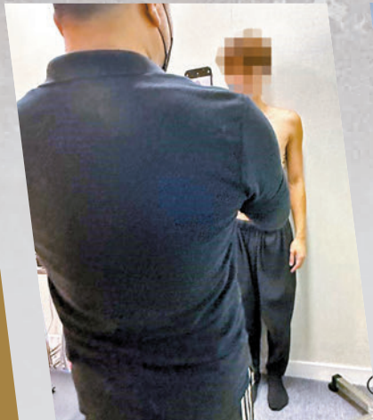
◆有「痛症中心」會拍下顧客容貌。