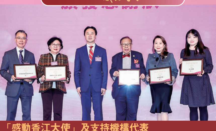
「感動香江大使」及支持機構代表