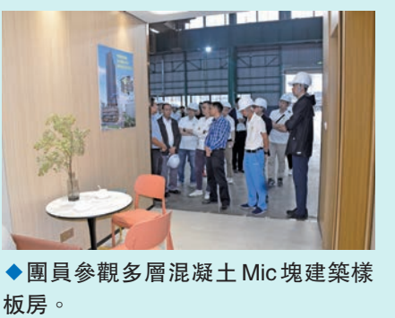
◆團員參觀多層混凝土Mic塊建築樣板房。