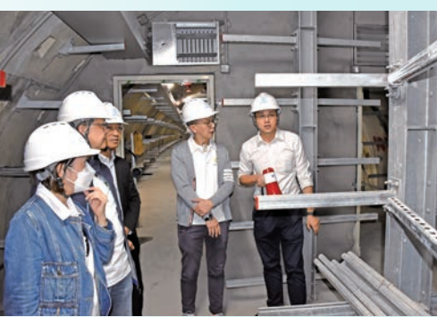
◆團員參觀佛山廣州市政路橋基地。