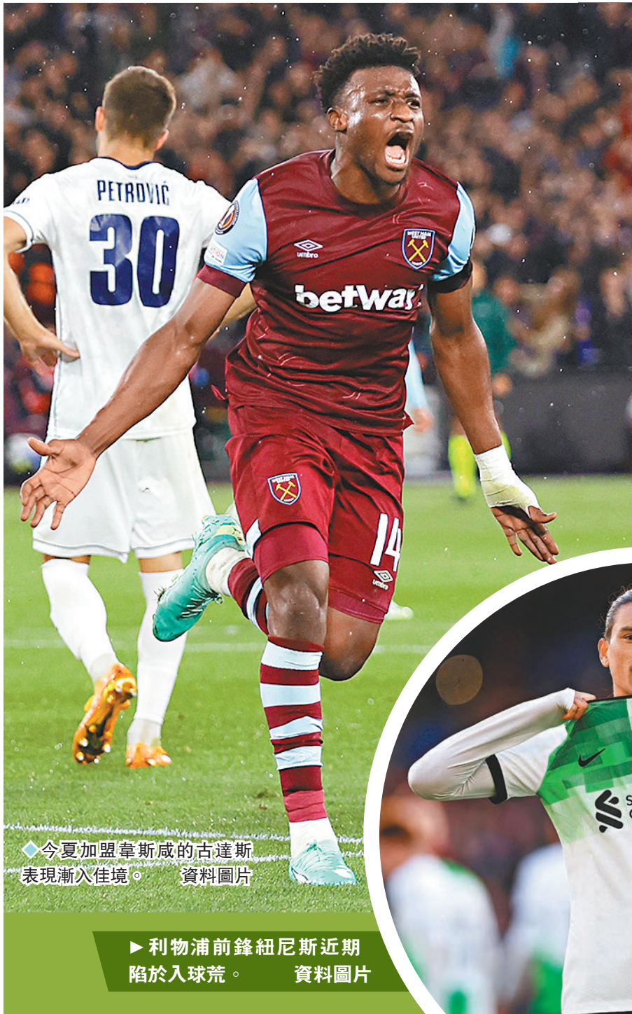
◆今夏加盟韋斯咸的古達斯表現漸次佳境。資料圖片

剛在「雙紅會」痛失兩分的「紅軍」利物浦，將於香港時間周四凌晨的英格蘭聯賽盃8強比賽再度登場，對手為韋斯咸。從過去周日「雙紅會」所見，利物浦前場把握力明顯遠遠不及過往全盛時期，因此是役面對近況不俗兼反擊力強的韋斯咸，隨時會再次陰溝裏翻船。(HOY TV 77台周四4:00a.m.直播) ◆香港文匯報記者 楊浩然