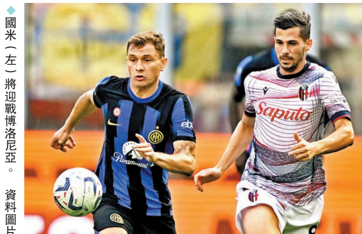
◆國米(左)將迎戰博洛尼亞。資料圖片

敗波圖，14輪過後取得34分，繼續以1分優勢领跑聯賽積分榜。累積31分的波圖則降至積分榜第3位。 ◆新華社