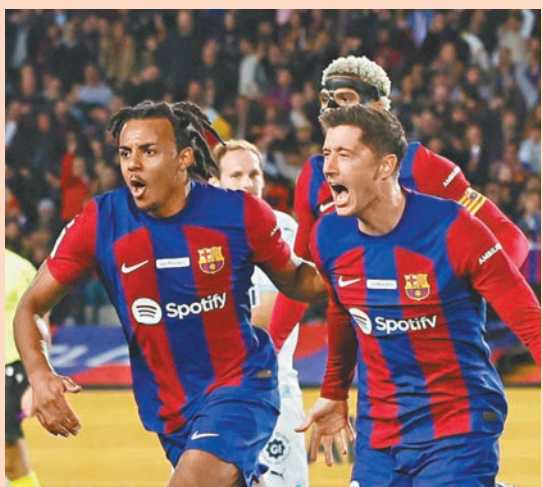
◆巴塞有望憑藉主場之利爭勝。資料圖片

最強黑馬基羅納登場，結果球隊憑杜夫比克個人梅開二度，加上橫圖的入球，主場輕鬆以3:0擊敗艾拉維斯，賽後以17戰得44分，兩分力壓皇家馬德里重返榜首。