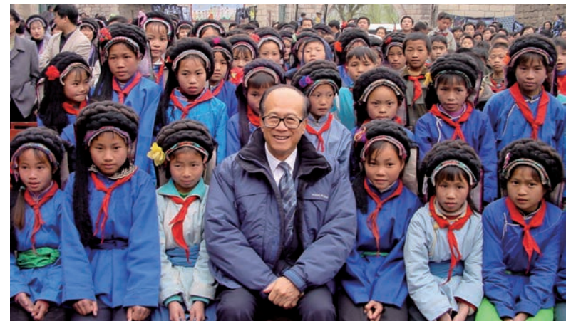
▲李嘉誠於1980年創立李嘉誠基金會，視之為他的「第三個兒子」，投入其三分之一資產，至今已捐出總款逾300億港元，其中約80%的項目在大中華地區。

李嘉誠說：「在華人傳統觀念中，傳宗接代是一種責任，我呼籲亞洲有能力的人士……能視幫助建立社會的責任有如延續後代同樣重要，選擇捐助資產如同分配給兒女一樣，那我們今天一念之悟，將會為明天帶來很多新的希望。」他更表示，一生最重要的決定是成立基金會，能盡心之所懷服務社會，感刻至深。自2018年退任長江集團主席後，李嘉誠旋即披上新戰衣，全心全力投入基金會工作。