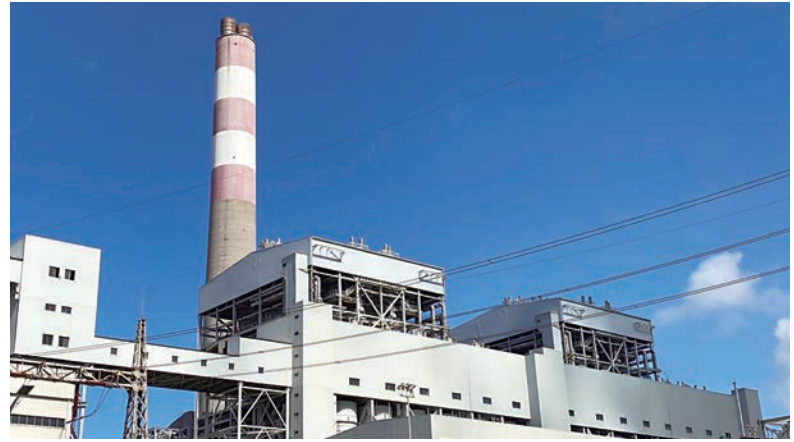
▲電能實業旗下金灣發電廠位於珠江三角洲西部的電力負荷中心，為區內工業提供穩定電力。

電能實業旗下的港燈亦積極配合「一帶一路」建設，連續六年支持由香港理工大學及西安交通大學成立的「絲綢之路國際工程學院」，聯同國家電網有限公司，推展「一帶一路電力能源高層人才發展計劃」。2023年，來自10個國家或地區共32名電力能源專員，更到訪港燈的南丫發電廠及電纜隧道，促進交流和汲取寶貴經驗。