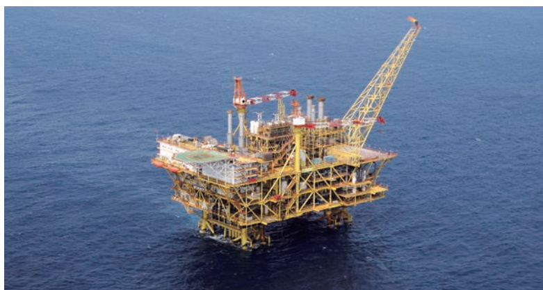
▲圖為荔灣天然氣項目的中心設施平台。

2004年，赫斯基通過與中海油的合作在內地率先進入深水領域勘探天然氣，於2006年在南海的勘探作業中取得重大突破，發現了中國第一個深水氣田「荔灣3-1」，隨後相繼發現「流花34-2」和「流花29-1」氣田。荔灣項目從開發到投產花了約7年時間，是世界上發展最快的大型深水氣田開發項目之一。自2014年投產以來，已向大灣區多家發電廠供應逾11,950億立方呎天然氣及近5,290萬桶凝析油。