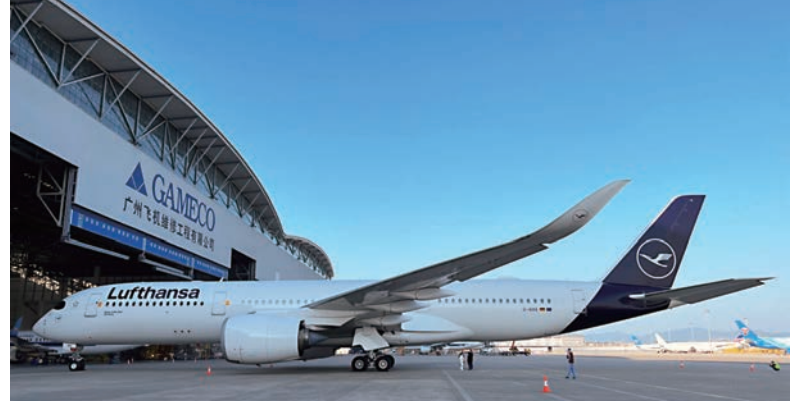
▲圖為廣州飛機維修工程的機庫。

此外，和黃中國積極參與在內地、香港及英國多個企業與項目投資，其中包括生產及銷售家居及工業清潔用品；分銷個人消費品；提供物流服務以及經營稻田和稻米貿易業務等。