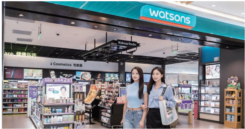
▲圖為保健及美容零售店「屈臣氏」。

在食品工業方面，集團旗下屈臣氏實業是內地歷史最悠久的飲料廠商之一。家喻戶曉的飲品品牌有屈臣氏蒸餾水、菓汁先生和新奇士等，在內地的忠實消費者達1,500萬。公司的內地飲品製造業務以廣州為主要製造中心，另外於北京等城市設有10個生產基地。