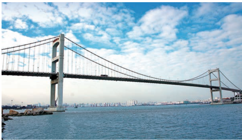
▲長江基建於1993年首度參與發展內地收費道路及橋樑項目。

集團亦在香港及內地經營基建材料製造業務，並一直參與各項基建工程，包括大型地標如港珠澳大橋及廣深高速鐵路等。