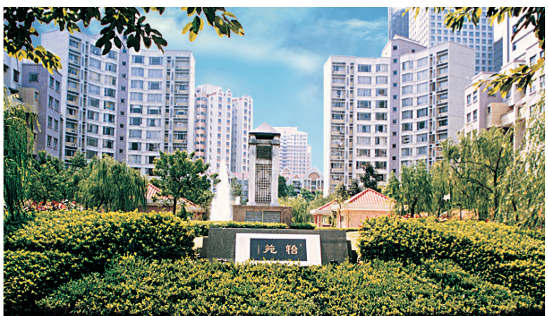
▲長江實業於1994年在廣州推出首個住宅項目「怡苑」，其後多個項目於內地不同城市相繼落成。

目前，長江實業在內地約20個城市擁有50多個房地產項目，連同旗下持有權益之房地產投資信託基金，集團在內地之可供發展土地儲備超過6,000萬平方呎，投資物業及酒店達1,500萬平方呎。