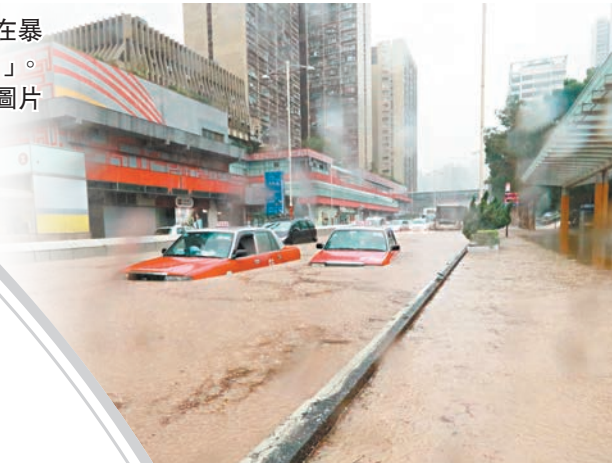
◆今年9月，黃大仙在暴雨下淪為「澤國」。

此外，太空所未來會爭取把國家的衛星與中大的衛星在香港及粵港澳灣區組網，形成「衛星星座」(satellite constellation)，進一步提高監測的精確度和頻率。