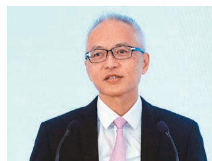
◆金管局副總裁李達志表示，IADS先導計劃為香港的數字經濟增添動力。資料圖片

金管局副總裁李達志表示，IADS先導計劃在銀行業邁向以客戶為中心的發展旅程中標誌重要里程碑，期望此計劃能讓客戶進一步釋放其銀行賬戶數據的潛力。他指，銀行同業按客戶意願安全共享賬戶數據，能助銀行和客戶提升效率，降低成本，並帶來創新的數碼服務和解決方案，使雙方都能受惠，亦為香港的數字經濟增添動力。