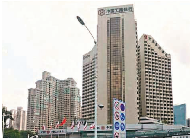
◆工行發布公告稱,自今日起下調存款掛牌利率。

繼11月中旬中小銀行降低存款利率之後,國有大行又率先開啟新一輪定期存款「降息」。工商銀行昨公布,今日(12月22日)起下調存款掛牌利率,涉及通知存款、整存整取等多個存款品種,其中3年期定期存款掛牌利率時隔多年首次跌破2%。建設銀行、中國銀行、農業銀行、郵儲銀行等多家銀行也將同日起調整存款掛牌利率,多家全國性股份制銀行亦將跟進調整。