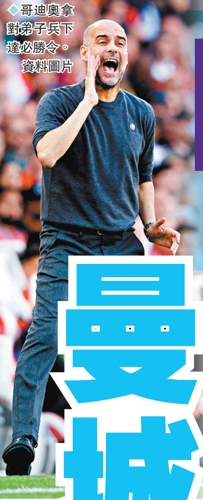
◆哥迪奧拿對弟子兵下達必勝令。