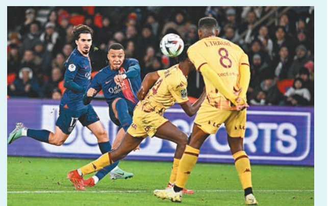
◆麥巴比(左二)入球瞬間。

香港文匯報訊（記者 梁志達）多位球員都在本港時間昨日凌晨的比賽中梅開二度爭相立功，計有巴塞隆拿的沙治羅拔圖、歡慶生辰的巴黎聖日耳門（PSG）球星麥巴比以及利物浦中場小將居迪斯鍾斯。