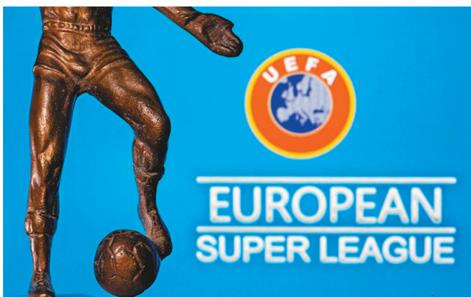
◆歐超聯這個新比賽最終會否成事？

皇家馬德里、巴塞隆拿、祖雲達斯等12家歐洲頂級豪門球會2021年4月宣布成立歐超聯，這將對UEFA帶來可觀財源的歐聯以至西甲、意甲、英超三大聯賽造成衝擊。UEFA之後以參加歐超聯的球隊將被禁止參加聯賽、歐洲賽甚至國際賽作威脅，之後接連兩天，曼聯和車路士等6家英超球會，以及馬德里體育會、國際米蘭和AC米蘭都宣布退出歐超聯。不過，皇馬主席佩雷斯沒有放棄，為歐超聯成立的A22體育公司亦相繼向馬德里法院以至歐盟法院提出訴訟。