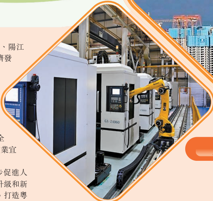
◆珠江口西岸都市圈將打成為具有全球影響力的先進裝備製造基地。圖為珠海格力電器自動化生產線。資料圖片

《規劃》明確要求推進都市圈公共旅遊碼頭建設，發展遊艇旅遊，依法開闢國際、國內航線，與廣深港澳等打造「一程多站」一體化郵輪旅遊線路。在創新發展機場航空服務產品方面，支持發展與旅遊業相適應的低空飛行服務，包括優化跨境直升機服務，以珠海橫琴、中山翠亨新區、江門大廣海灣經濟區為試點率先開放低空空域，在與港澳協調一致的情況下探索發展覆蓋港澳的低空飛行觀光旅遊業務，研究開通对接港澳的跨境直升機服務。