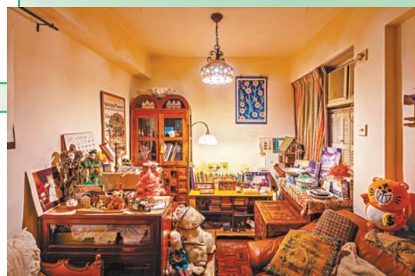
◀西西故居客廳中的傢具和擺設日後將陳列於「西西空間」。