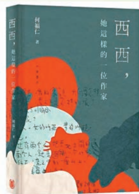
◆《西西，她這樣的一個作家》

著作為單位來評論；「回應」集中討論紀錄片《我城》與《候鳥——我城的一位作家》，以及趙曉彤所編的《西西看電影》套書；「追思」為悼念文章，以深情的筆調回顧西西精彩、愉快、有意義的一生。書末的「附錄」由訪問和年表構成，其中「西西年譜」乃目前最完備、準確的資料，羅列西西生平大小事件，包括發表、出版、獲獎、外遊等。