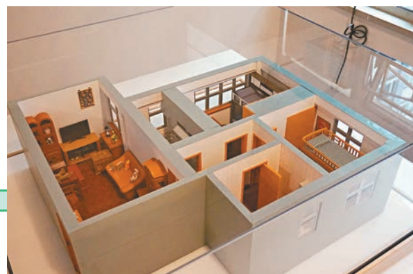
◀「西西空間」中陳列仿其故居建造的微型屋模型。