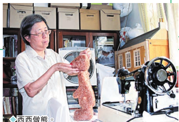
◆西西做熊。 《從跳格子到坐飛氈》內頁圖。