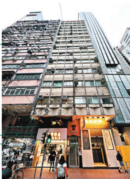
▲「西西空間」設於灣仔富德樓。