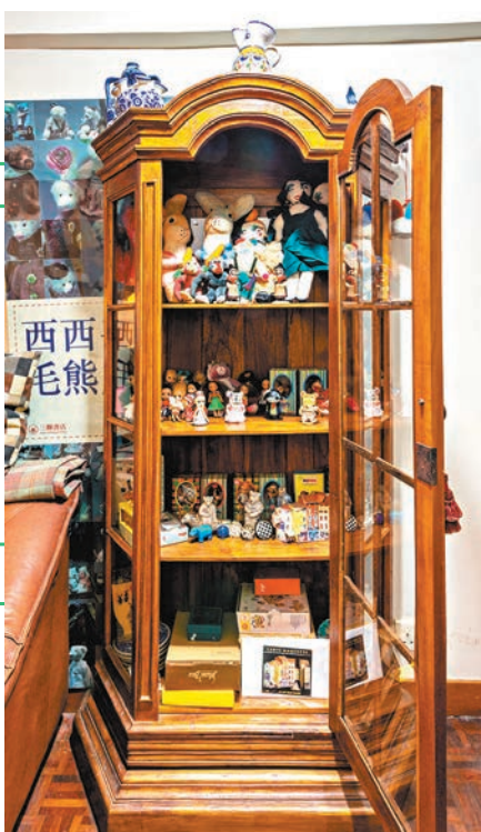
◆西西的玩具櫃如同一個小型展覽。