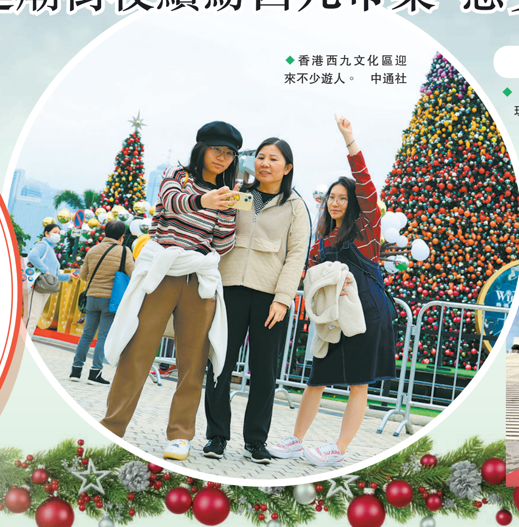
◆香港西九文化區迎來不少遊人。

港珠澳大橋旅遊試運營自12月15日開通以來持續火爆，港澳和內地居民可以經大橋珠海口岸出發，參團乘坐旅遊專巴遊覽大橋及登陸藍海豚島，近距離感受貫長虹的「中國跨度」。香港文匯報記者24日從港珠澳大橋遊官方微信公眾號獲悉，大橋遊的旅遊專巴售票即日起至1月7日均已基本「約滿」，覆蓋聖誕、元旦假期，過萬名遊客追捧大橋遊。而據多家旅行社反映，大橋遊聯動帶旺港澳遊與珠海遊，「港珠澳2日遊」團至1月上旬收客火熱，有遊客先「大橋遊」再赴港澳過聖誕節。 ◆香港文匯報記者 方俊明 珠海報道