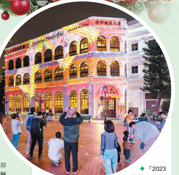
◆「2023 幻彩耀濠江」將持續至2024年2月。