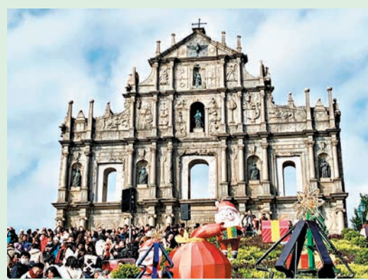
◆澳門大三巴聖誕裝飾搶眼。

澳門市政署在全澳多處裝設聖誕燈飾，部分廣場設置大型聖誕樹，與公眾歡度佳節。今年，塔石廣場續設聖誕市集，除多個禮品檔和小食檔，並設旋轉木馬、轉轉杯等遊樂項目及魔術、聖誕老人扭氣球等流動表演，還有供一家大小遊玩留影的打卡點。