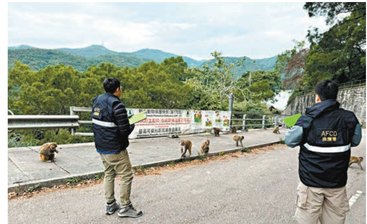
◆漁護署在聖誕長假期加強打擊非法餵飼野生動物活動。

香港文匯報訊(記者 蕭景源)聖誕長假期開始，市民或遊客會到郊野公園享受自然風光。為加強宣傳教育及打擊非法餵飼野生動物情況，漁農自然護理署(漁護署)由上周六(23日)開始至明日(26日)一連四日在金山郊野公園及獅子山郊野公園加強巡邏及執法行動。漁護署提醒市民，餵飼野生動物會影響牠們的天然習性及破壞生態平衡，並引起環境衛生和滋擾等問題，任何人非法餵飼野生動物都會被即時檢控。