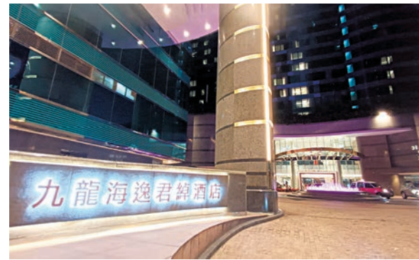
◆發生冒警劫案的九龍海逸君綽酒店。

警員其後翻看酒店內的閉路電視，鎖定兩名涉案男子，初步相信兩人均為本地人。其中一人肥身材，身高約1.8米，案發時穿黑色外套，戴黑色帽及口罩；另一人則瘦身材，身高約1.7米，案發時身穿黑色外套，戴黑色帽及口罩。案件現由九龍城警區刑事調查隊第五隊跟進。