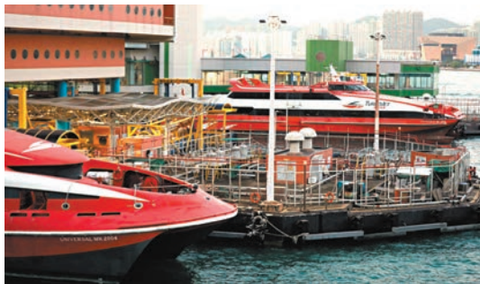
◆噴射飛航昨因電腦伺服器故障，服務一度受阻。圖為上環港澳碼頭。資料圖片

至下午3時，船公司更新帖文指售票處及入閣登船服務恢復正常；但網上售票服務仍在積極搶修。直至下午4時45分，船公司再次更新帖文，表示全部服務已經恢復正常。