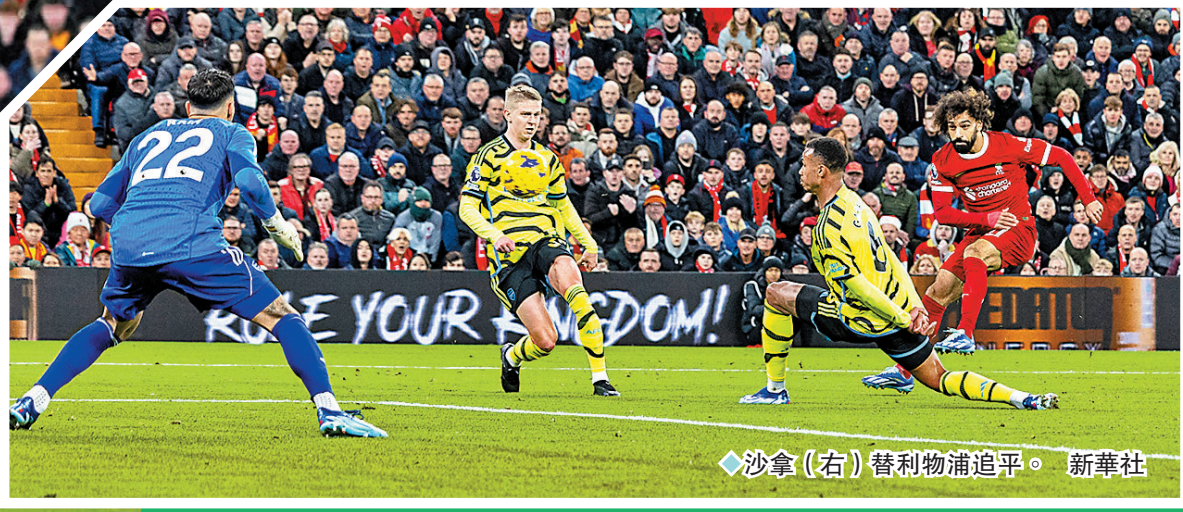
沙拿(右)替利物浦追平。新華社