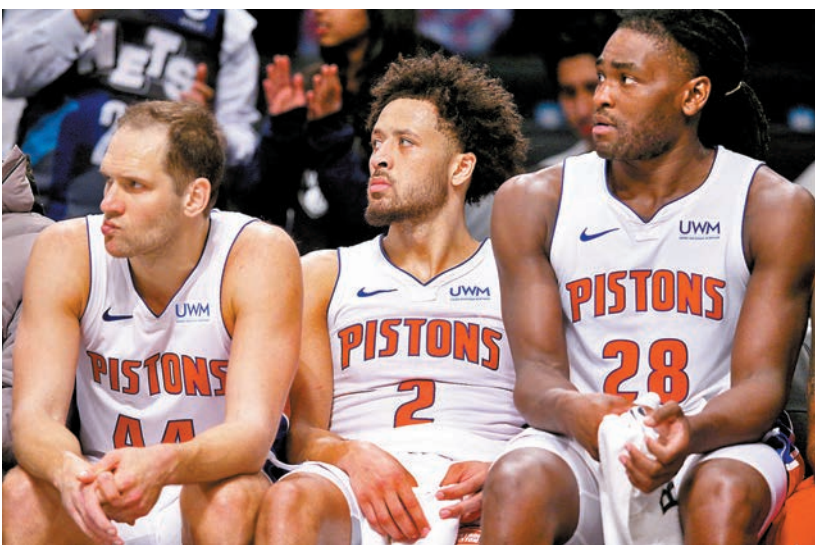
活塞球員對球隊戰績感到無奈。

連敗不止的NBA東岸球隊活塞，昨天作客籃網雖然全隊有3人得分超過20分大關，但還是以115：126落敗，追平聯盟單一賽季最長的26連敗。