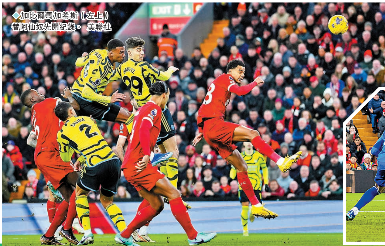
加比爾馬加希斯(左上)替阿仙奴先開紀錄。