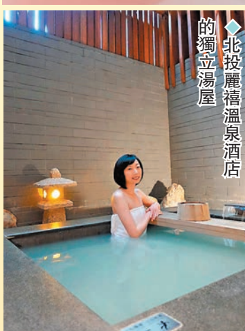
北投麗禧溫泉酒店 的獨立湯屋