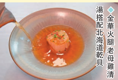
湯搭配北海道乾貝 金華火腿老母雞清