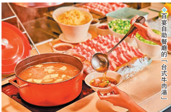
百宴自助餐廳的「台式牛肉湯」