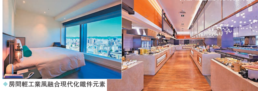
房間輕工業風融合現代化鐵件元素