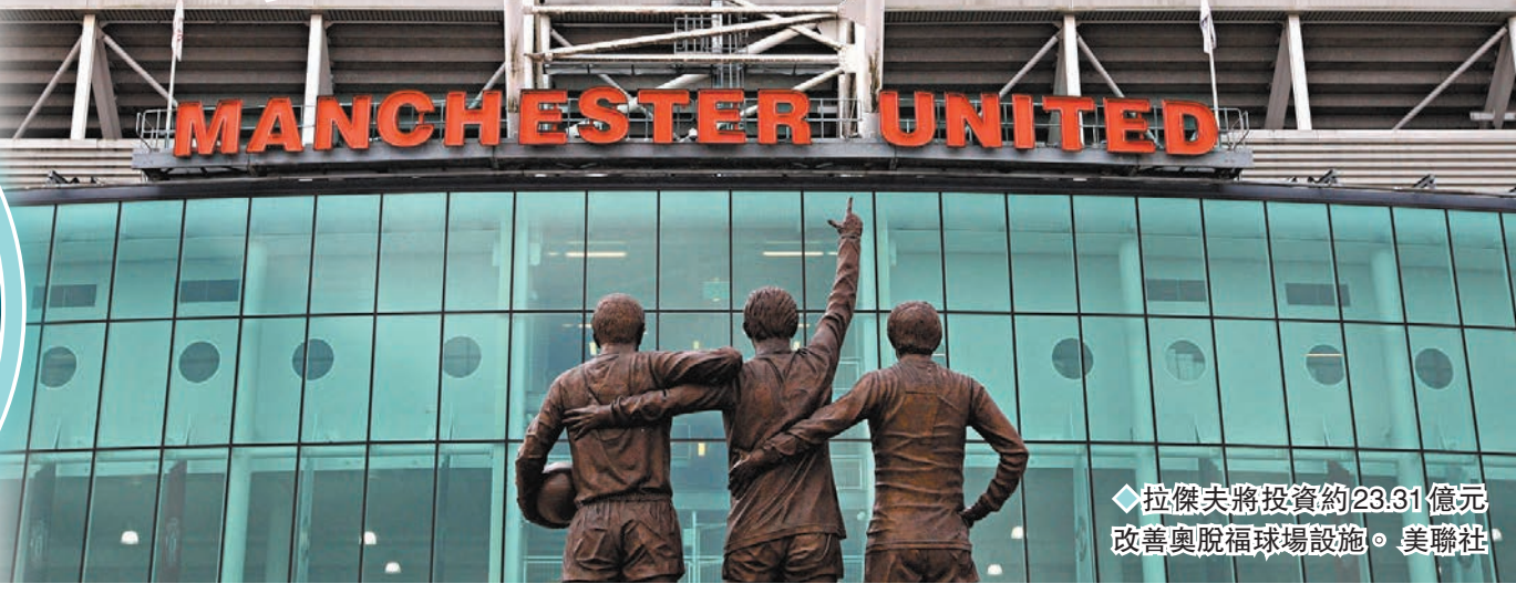
拉傑夫將投資約23.31億元改善奧脫福球場設施。