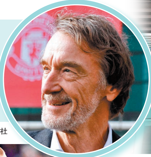
英國富商拉傑夫收購25%曼聯股份。

英超球會曼聯當地時間24日在官網發布聲明，他們已和英力士化工集團(INEOS)主席拉傑夫達成協議，由後者收購曼聯最多25%的A類股，英力士化工集團在足球運營方面負有委託責任。