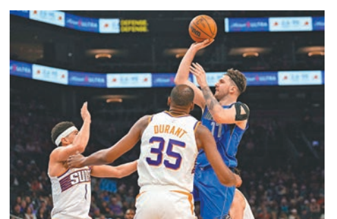
當錫(右)職業生涯突破1萬分。

據台媒報道，美國職籃NBA達拉斯獨行俠昨天以128:114擊敗鳳凰城太陽，其中獨行俠球星當錫全場轟下50分，送出15助攻，不僅達成生涯總得分1萬分里程碑，還成為史上第4名在聖誕大戰單場拿到至少50分的球員。洛杉磯湖人球星安東尼戴維斯則在主場攻下40分，成為繼2004年高比拜仁後，隊史首位在聖誕大戰拿下40分的球員，但湖人最終仍以115:126敗給波士頓塞爾特人，自季中錦標賽結束後近8戰6敗。