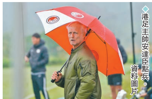
港足主帥安達達點兵。資料圖片

亞洲足協容許今屆亞洲盃決賽周球隊註冊26名球員，而今次港足決選名單只有25人，或留一名額為補選球員之用。