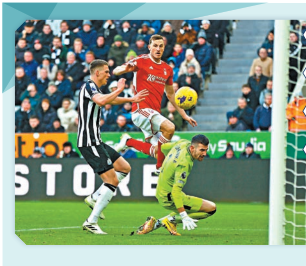
昨晚英超早場比賽，基斯活特連中三元，幫助護級球隊諾定咸森林作客以3:1，反勝早段憑阿歷山大伊沙克射入12碼一度領先的紐卡素。紐卡素近5場聯賽4敗。圖為基斯活特(中)射成2:1。