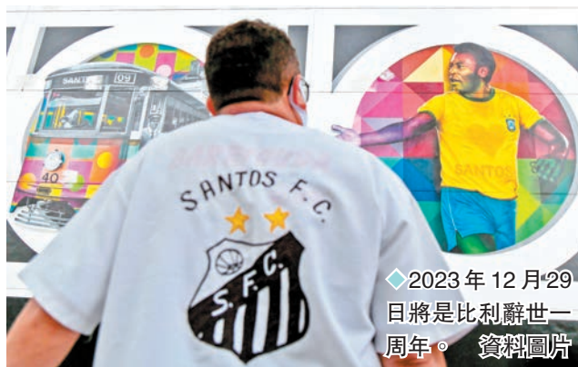
2023年12月29日將是比利辭世一周年。

1和3負積7分成績，在積分榜10支球隊中排第6。本月底即將紀念該國名宿比利辭世一周年，比利兒子艾甸奴對巴西隊的現況發表了看法，「這場危機不是一夜間出現，而是有着巨大而複雜的問題。球隊正在下滑……我們仍有出色的球員，但以前我們有的高水平球員比今天多……如果(比利)今年還在世，他也會很傷心。」