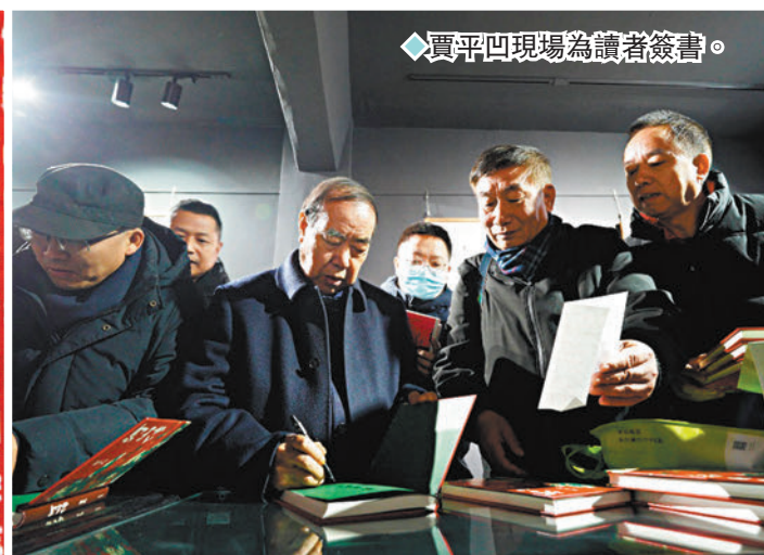
◆賈平凹現場為讀者簽書。

12月17日，「一路趑趄走來，感謝有你——賈平凹文學創作歷程展」在西安建築科技大學賈平凹文學藝術館開展。此次展覽展出了近千件賈平凹文學創作藏品，是見證作家創作和當代文學的珍貴物證。此次展覽作為賈平凹文學創作50周年的系列活動之一，將持續展至2024年3月15日，期間免費面向公眾開放。