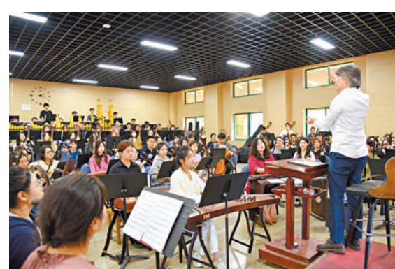
◆香港中樂團助理藝術總監兼常任指揮周惠昌為西安音樂學院學生講課。

「此次演出，我們的樂曲多為傳統民樂器，比如古琴、古箏等，特別是我們新近還購置了一套編鐘。」雖然被譽為是中國