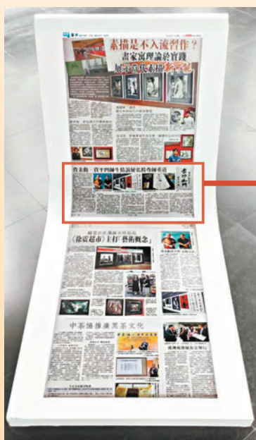
◆香港《文匯報》報道版面被做成藝術裝置，擺放在展廳的中心位置。