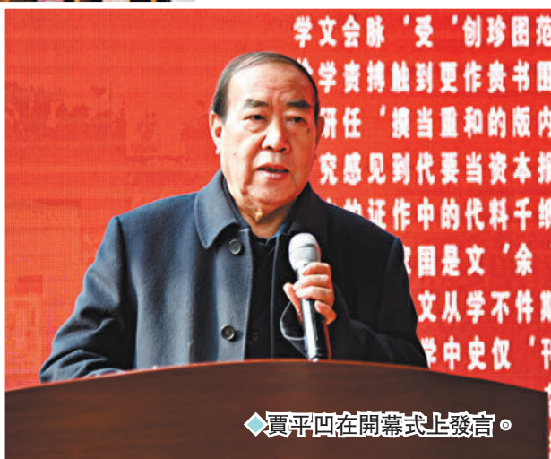
◆賈平凹在開幕式上發言。