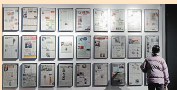
◆香港《文匯報》、《大公報》有關賈平凹報道的多個版面被置於顯要位置。