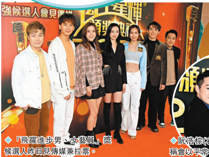
「飛躍進步男、女藝員」獎候選人昨日見傳媒兼拉票。