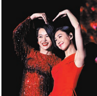
◆胡定欣(右)與胡杏兒情同姊妹。