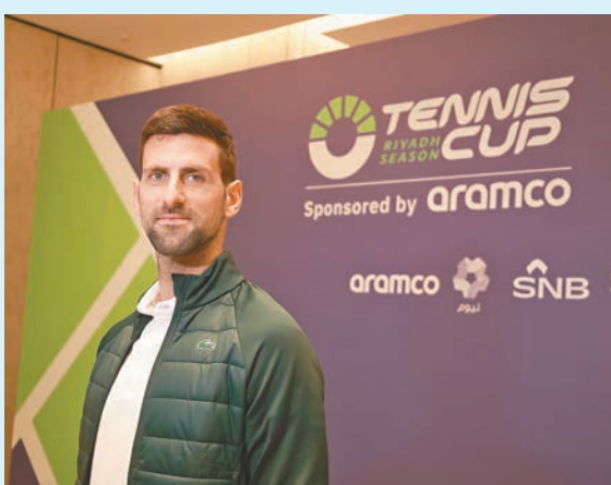
◆祖高域希望明年到中國比賽。