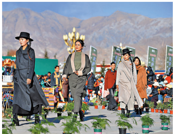
12月24日，藏裝秀表演現場。