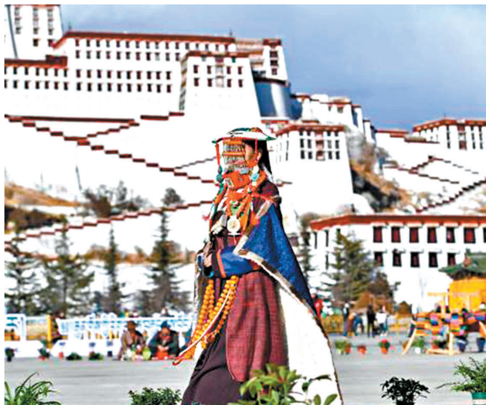
◆ 阿里普蘭縣傳統「鮮鮮」服飾。