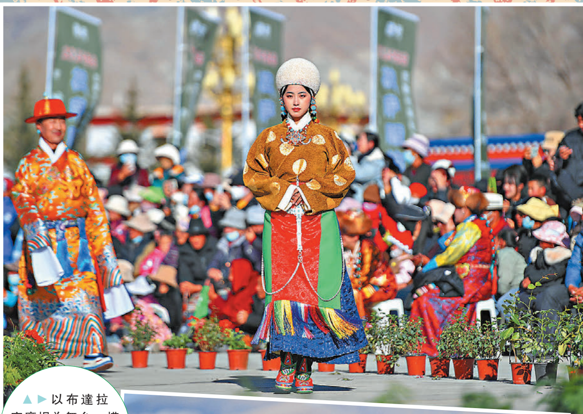
▲ 以布達拉宮廣場為舞台，模特向觀眾們展示了68套傳統藏民族服飾。