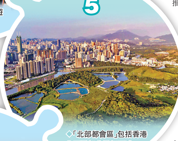
◆「北部都會區」包括香港北區及部分元朗區域。