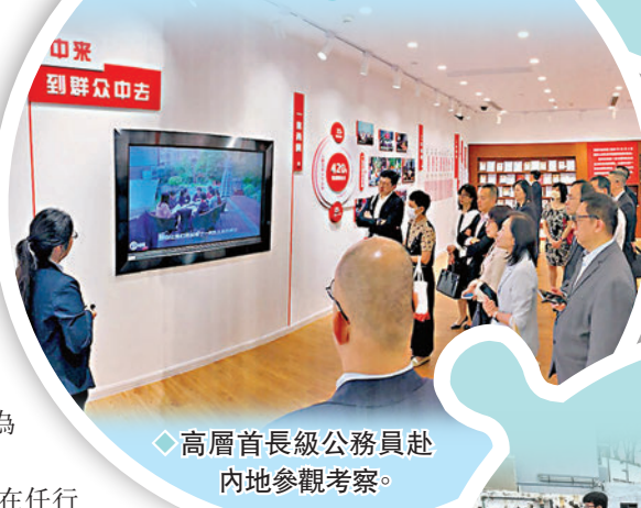
◆高層首長級公務員赴內地參觀考察。