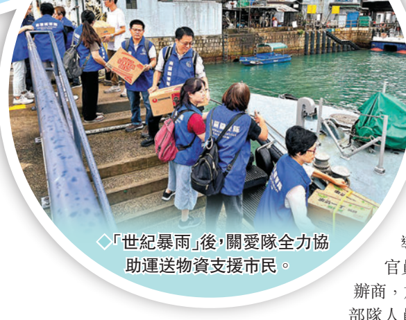
◆「世紀暴雨」後，關愛隊全力協助運送物資支援市民。