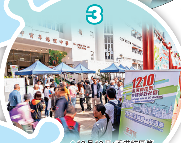
◆12月10日，香港特區第七屆區議會一般選舉進行投票。

立法會議員陳學鋒指出，今年香港經歷了百年罕見的暴雨，當時石澳道由於許多樹木倒塌，導致大浪灣村、石澳村約兩千名居民被困，惡劣的天氣導致區內通訊系統中斷，他當時特別憂心區內的獨居長者，隨即要求政府高層官員盡速應對；同步聯絡南區關愛隊採購物資，隨時支援，以及主動聯絡政府承辦商，加快清理阻塞道路的雜物。在事發第二天，保安局局長、消防處處長以及紀律部隊人員便親身到場支援。他指出，是次雨災期間沒有出現重大傷亡事故，實有賴官、商、民的多方合作，讓市民生活快速回復正常。