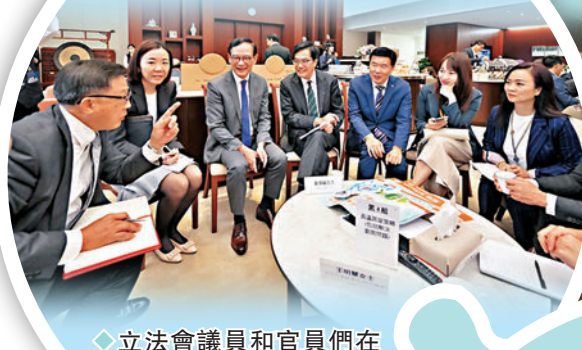
◆立法會議員和官員們在「前廳交流會」上就各議題作深入探討。

身為立法會環境事務委員會主席，她於8月份曾與環境及生態局局長謝展寰到大灣區內地城市進行職務訪問，了解內地新能源發展、轉廢為能設施等，大家在對於加快推動電動車的充電設施的探討過程中產生很多共識，而在今年的施政報告中，增加充電設施的目標被寫入施政報告，她認為這是行政立法關係之間溝通質量有成效、有所提升的體現。