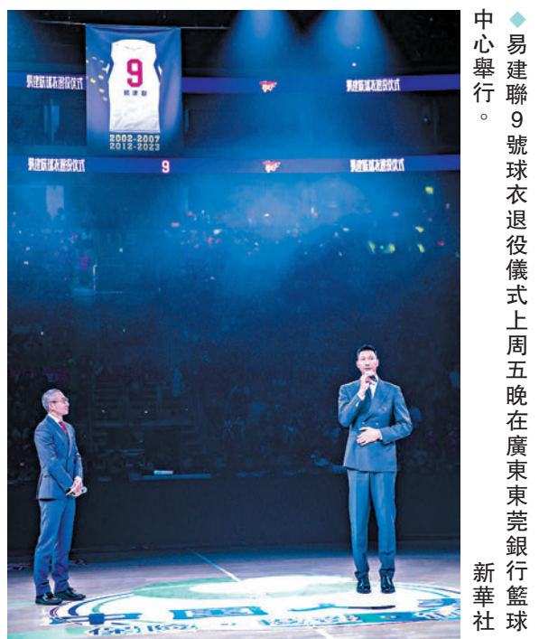
◆易建聯9號球衣退役儀式上周五晚在廣東東莞銀行籃球中心舉行。 新華社

「易建聯」的傳奇故事揭開序幕。四次奧運會之旅,七屆CBA總冠軍,生涯征戰16個CBA賽季,共參加625場聯賽,總計得分12,781分,CBA本土球員歷史得分最高,5屆CBA常規賽最有價值球員,3屆CBA總決賽最有價值球員……獨一無二,他是易建聯。 ◆中新網