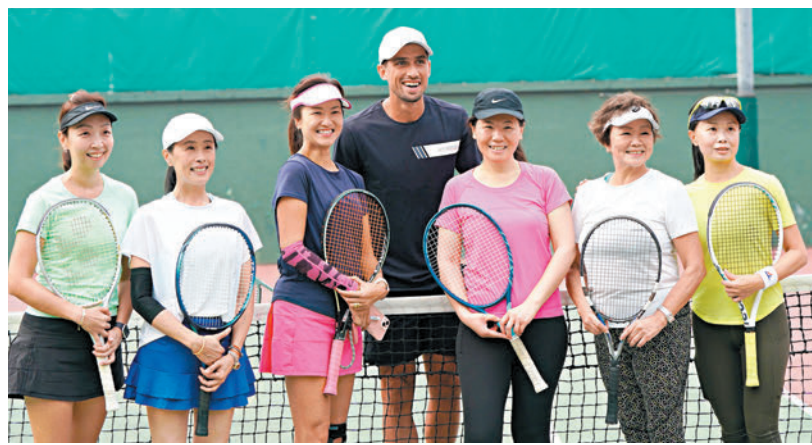
◆卡千(中)與網球愛好者合影。

ATP(職業網球聯合會)巡迴賽睽違21年後今起一連8日再度於香港舉行,包括世界排名第5的盧比利夫、排名第15的卡真洛夫、排名第16位的迪亞科爾、前大滿貫冠軍施歷、排名第41位的麥當奴、排名第70的卡千、本地網球精英黃澤林以及內地新星商竣程等人在內的多名國際頂尖球手雲集維園網球場,角逐「中銀香港網球公開賽2024」。其中來自阿根廷的網球球星卡千(Pedro Cachin)昨日率先來臨銅鑼灣香港中華遊樂會與一眾網球愛好者交流,分享網球運動的樂趣。卡千於活動後接受訪問時表示取得ATP系列賽冠軍需要付出很多,但對於今日展開的香港公開賽,他直言希望可以殺入準決賽。