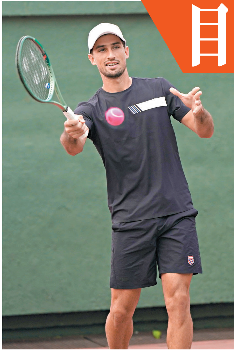
◆卡千希望在今日揭幕的香港公開賽殺入4強。