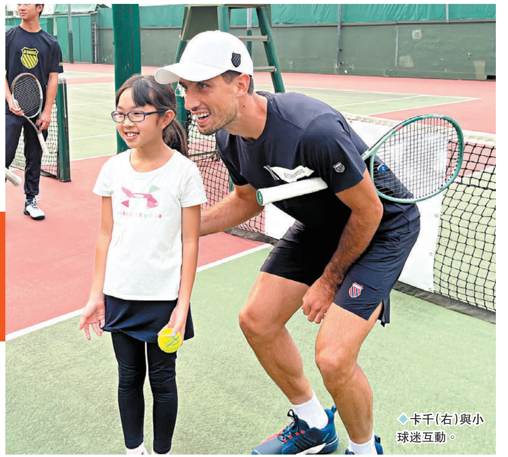
◆卡千(右)與小球迷互動。

ATP(職業網球聯合會)巡迴賽睽違21年後今起一連8日再度於香港舉行,包括世界排名第5的盧比利夫、排名第15的卡真洛夫、排名第16位的迪亞科爾、前大滿貫冠軍施歷、排名第41位的麥當奴、排名第70的卡千、本地網球精英黃澤林以及內地新星商竣程等人在內的多名國際頂尖球手雲集維園網球場,角逐「中銀香港網球公開賽2024」。其中來自阿根廷的網球球星卡千(Pedro Cachin)昨日率先來臨銅鑼灣香港中華遊樂會與一眾網球愛好者交流,分享網球運動的樂趣。卡千於活動後接受訪問時表示取得ATP系列賽冠軍需要付出很多,但對於今日展開的香港公開賽,他直言希望可以殺入準決賽。