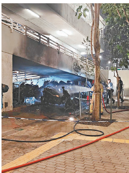
◆消防員在小西灣道天橋底向起火電單車射水降溫。

香港文匯報訊（記者 蕭景源）小西灣發生縱火燒車案。9輛停泊在小西灣道15號一天橋底的電單車前晚突告起火焚燒，一時間火光熊熊。消防員將火撲熄後經調查，相信起火原因有可疑，警方已列作縱火案處理，交由東區警區刑事調查隊跟進，設法緝捕縱火狂徒歸案。