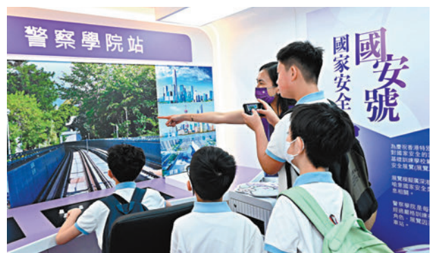
◆圖為去年4月警察學院舉行開放日，一班學生參觀「國安號」國家安全展覽。資料圖片

另外，在持續推動青少年防罪教育下，2023年首11個月因干犯嚴重毒品案的青少年被捕人數有156人，較2022年同期下跌43.9%，連續兩年下跌，創過去4年新低。有關跌幅相信與警方聯同各界持份者合作，共同推行禁毒宣傳教育有關，當中包括警方舉辦的禁毒領袖學院，邀請不同專業領域的顧問擔任導師，帶領學員設計及執行抗毒活動，推廣抗毒信息。