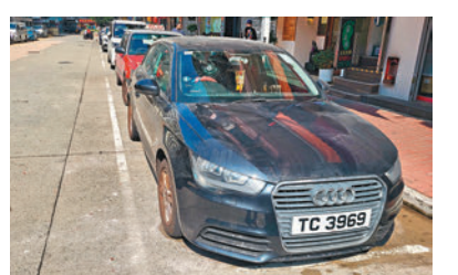
◆被樓上墜下的香爐及神主牌擊中的私家車擋風玻璃毀爛。

香港文匯報訊（記者 蕭景源）昨日上午在旺角鬧市發生天降神主牌及香爐事件，一輛停泊樓下咪錶位的私家車慘遭砸毀車頭擋風玻璃及沾滿香爐灰，幸無釀成傷亡。女車主事後折返頻呼好彩：「如果早一分鐘就砸落個頭度……」惟原本與家人約好的除夕午膳被迫取消。警方已接手案件列作高空墮物跟進，暫無人被捕。