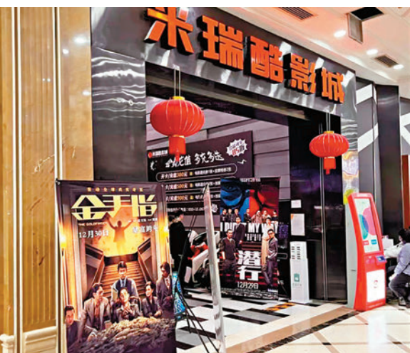
◆ 元旦賀歲檔中，《金手指》開畫首日排映超7.45萬場。圖為影城門口《金手指》海報。

另外一個可喜的現象是，中小成本影片將觀眾吸引進影院。以暑期檔為例，今年憑借206億元的票房成為「史上最強」暑期檔，分別收穫38.47億元、35.23億元票房的《孤注一擲》和《消失的她》，以及《八角籠中》《熱烈》《茶啊二中》等影片都是中小成本電影，從各個方面彰顯着創作者的創造力，在這些作品百花齊放的態勢下，暑期檔有52.7%的觀眾是今年第一次走進電影院，這種「拉新」能力對中國電影市場持續健康的發展意義深遠。