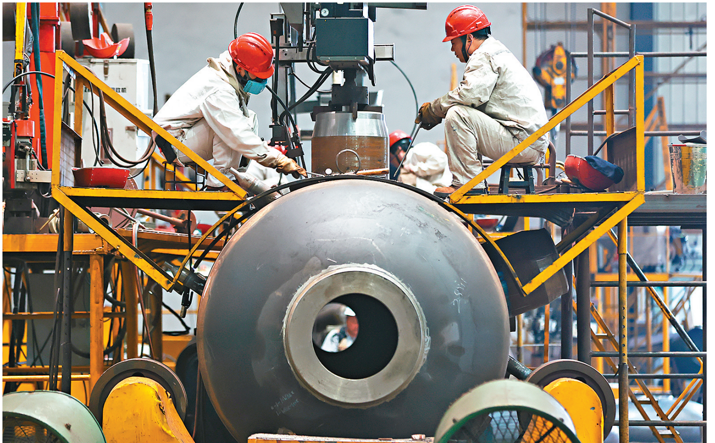
◆ 2023年12月份製造業PMI中，生產指數為50.2%，比上月下降0.5個百分點，仍高於臨界點，製造業企業生產連續七個月保持擴張。圖為江蘇南通一企業，工人在工作中。

製造業景氣水平雖有波動，但市場預期穩定。趙慶河表示，12月份，生產經營活動預期指數為55.9%，比上月上升0.1個百分點，連續六個月位於較高景