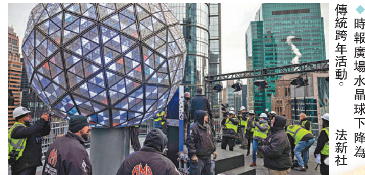
◆時報廣場水晶球下降為傳統跨年活動。法新社

紐約市長亞當斯表示，由於有可靠情報顯示巴以衝突引起的示威將干擾慶祝活動，警方將安排數千名警員在活動區域值勤，其中包括反恐單位。警方表示，局方正監控社交媒體，並為潛在示威活動做足準備，無論示威活動規模大小，執勤警員都會及時應對。亞當斯亦強調，市政府尊重大眾和平抗議的權利，但不能以阻礙他人迎接新年為代價。當局會出動無人機對人群進行監視，且會出動機械人和機械狗等協助巡邏。