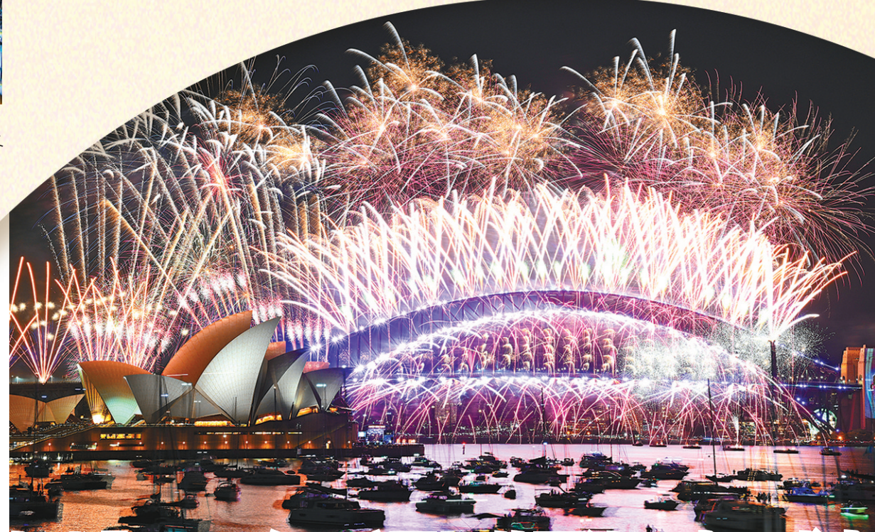
◆悉尼市長指今次煙花匯演籌備15個月，規模比以往都要盛大。