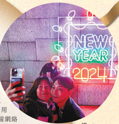
◆韓國首爾情侶慶祝跨年。

數碼游牧民群體是指無需辦公室等固定工作地點，而是利用技術手段尤其無線網絡技術進行遙距工作的人。目前有15個歐洲國家推出類似數碼游牧簽證，但申請標準各有不同。數據顯示，全球估計約有3,500萬數碼游牧民，他們每年的支出約7,870億美元（約6.1萬億港元）。