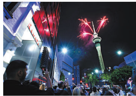
◆新西蘭奧克蘭民眾駐足欣賞煙花。

新西蘭於香港時間周日晚上7時便踏入2024年，雖然天氣欠佳，但無助民眾觀賞煙花的熱情。最大城市奧克蘭的天空塔在踏入新年一刻，發放歷時5分半鐘的煙花，附近並舉行激光和動畫表演慶祝。惠靈頓跨年慶典於當地時間晚上8時開始，有樂隊表演助興，並在9時30分首先舉行小型煙花匯演。