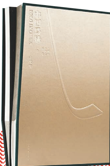
◆《中國馬球》 文物出版社出版