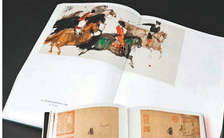
▶《中國馬球》收錄了近五百幅中國古代馬球文物圖片。