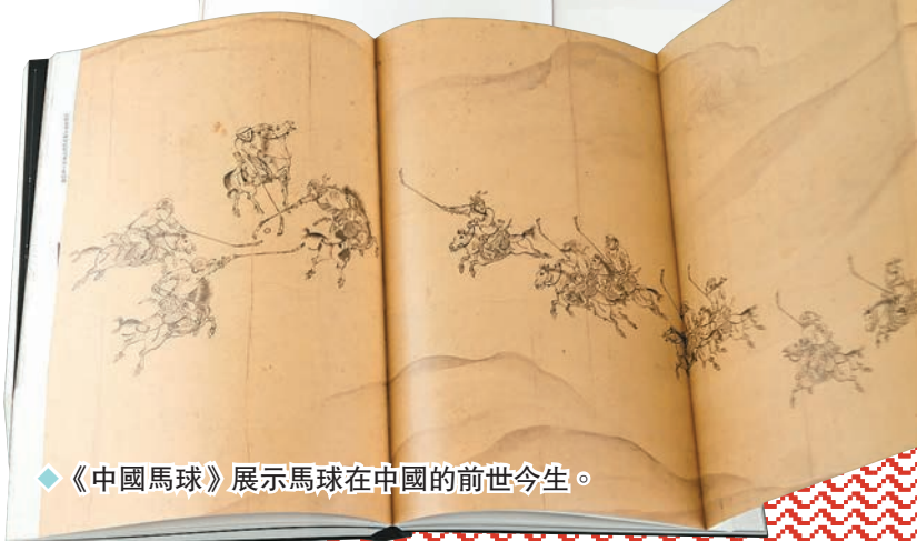
◆《中國馬球》展示馬球在中國的前世今生。