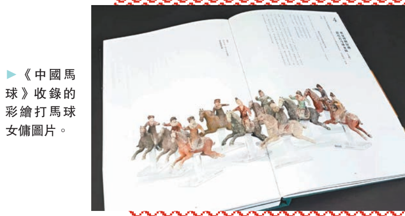
▶《中國馬球》收錄的彩繪打馬球女傭圖片。