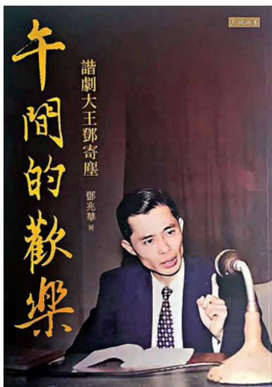
◆這書記述了鄧寄塵的功業，十分詳盡。

由這些風波中，可見鄧寄塵的急智和急才，諧而諷而非虛也，博觀眾一笑一樂而已。鄧寄塵歿後，誰還有此才？