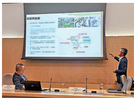
◆北部都會區統籌辦事處主任為調研組介紹情況。

對這個關係的重視程度遠遠高於香港，但香港方面的變化也是顯而易見的。舉個例子，在迄今為止26份特首施政報告中提及「港深」或「深港」的次數，董建華8份報告共提6次，曾蔭權7份報告共提16次，梁振英4份報告共提4次，林鄭月娥5份報告共提44次。李家超才作兩份報告，就提了27次。對香港而言，深圳早已不再是一個普通城市。港深之間，一種新的「前店後廠」格局呼之欲出：以前香港是深圳製造業進入世界市場的店，現在深圳越來越成為香港服務業融入國家發展大局的店。沒錯，香港是整個中國的香港，而深圳作為中國特色社會主義先行示範區，又何嘗不是整個中國的深圳。