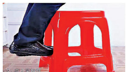
睇吓，踩爛張塑膠凳，撞落嚟你就知死！你講緊五十年代尾六十年代初呀，而家啲塑膠製品有咁「化學」嘍啲！