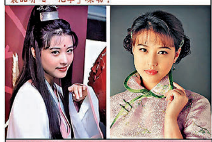
《倚天屠龍記》周芷若 《大鬧廣昌隆》小芙蓉 周海媚(1966-2023)