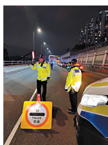
◆港島總區交通部打擊交通違例事項。

香港文匯報訊（記者 蕭景源）警方於2023年聖誕節至2024年元旦長假期間，針對酒後駕駛、毒後駕駛等違法行為加強執法，其中新界北總區及港島總區交通部執行及管制組人員，在各主要幹道設置路障，共截查近3,500架車輛，並向駕駛人士進行酒精呼氣測試。行動中，合共拘捕26名男司機，當中6人更被揭發是通緝犯。警方嚴厲譴責涉案司機不負責任的駕駛行為，將繼續嚴正執法，絕不姑息。