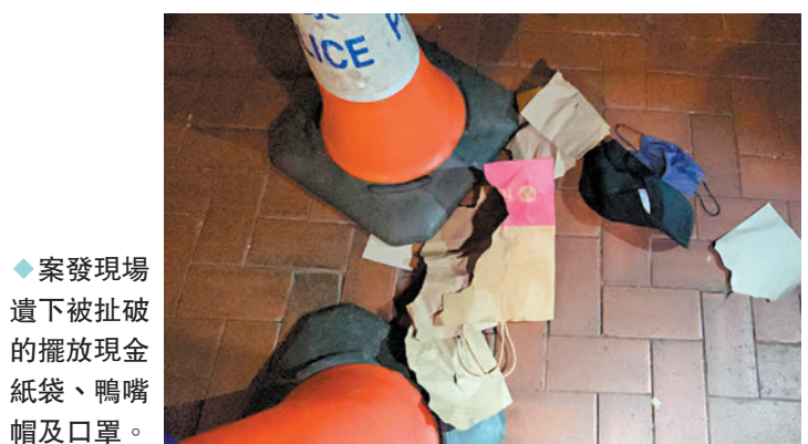
◆案發現場遭下被扯破的擺放現金紙袋、鴨嘴帽及口罩。

香港文匯報訊（記者 蕭景源）佐敦發生「攔途截劫」案件。一名男子昨日深夜相約債仔在街頭交收約25萬元欠款後，攜同載有現金的紙袋獨自步行離開往取車，半路突遭兩名匪徒撲出一輪拳打腳踢及搶奪紙袋，糾纏間紙袋被扯破跌出錢，兩匪隨即掠走大部分款項逃去無蹤，事主無奈負傷報警。警方已列作「行劫」案展開調查，不排除案件涉及知情者伏擊截劫，暫未有人被捕。