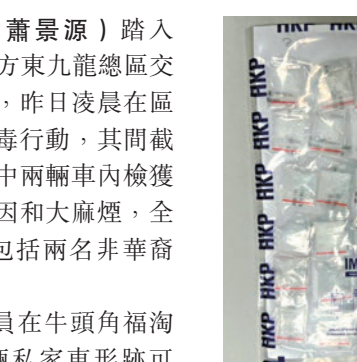
◆警方在東九龍區打擊藥後駕駛及販運危險藥物行動中，在涉案私家車上檢獲毒品。

香港文匯報訊（記者 蕭景源）踏入2024年元旦狂歡過後，警方東九龍總區交通部執行及管制組特遣隊，昨日凌晨在區內展開打擊藥後駕駛及販毒行動，其間截查多輛可疑私家車，在當中兩輛車內檢獲俗稱K仔的氯胺酮、可卡因和大麻煙，全部總值超8.7萬元。三人包括兩名非華裔男女被捕。