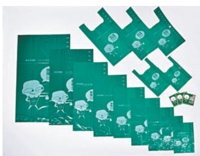
◆垃圾收費今年4月1日實施。資料圖片

香港文匯報訊（記者 吳健怡）今年4月1日起，香港將實施垃圾收費，大部分市民屆時須購買指定的垃圾袋棄置垃圾。但物業管理業監督局早前調查發現，約九成物管公司尚未與持份者達成收費模式等細節共識，該局理解業界對新措施反應慢熱，但期望政府為前線物管人員提供清晰培訓及工作指引，以及盡早公布安排。有屋苑初步計劃，在措施實施首3個月期間，向住戶免費派發指定垃圾袋，並聘請人手處理違規拋棄的垃圾。