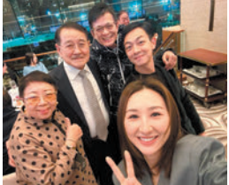
我身邊都是充滿正能量的朋友！

我身邊有很多充滿正能量的人，而事實上是需要更多這樣的人，社會才能撥亂反正，世界才可以走向和平。這位年輕醫生醫德好醫術好，外祖父母告訴他，當醫生便要有愛人的心，有正義感，還要醫術好，鼓勵他繼續努力於醫學界，為更多有需要的人服務，也是最大的愛！