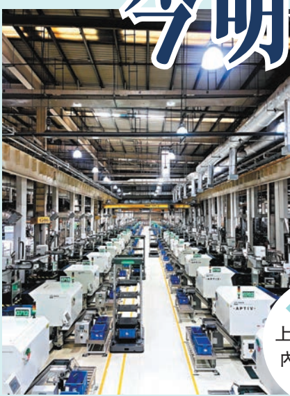
◆安波福上海智能工廠內景。