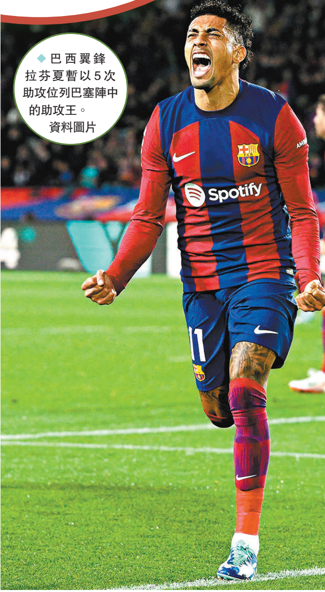
◆巴西翼鋒拉芬夏暫以5次助攻位列巴塞陣中的助攻王。 資料圖片