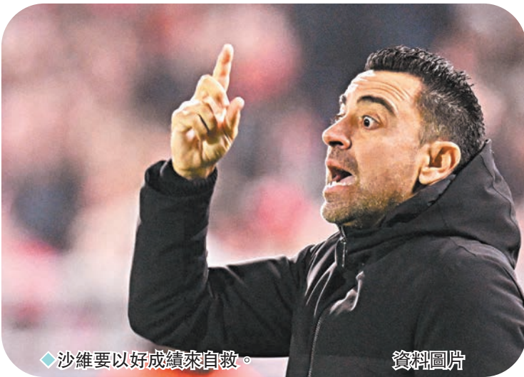
◆沙維要以好成績來自救。

在積分榜上，巴塞落後前兩名的皇馬及基羅納7分，暫因得失球差不及同分的馬德里體育會位列第4位，身後還有只差3分的畢爾包正在覬覦前四位置。巴塞當然希望能打響2024年的頭炮，惟對手拉斯彭馬斯今季主場只曾1敗，其餘4勝3和，反映球隊在自己地頭出擊表現頗為硬淨，主客場只失15球更是僅次於皇馬的鋼鐵防守，隨時可讓巴塞陷入「老鼠拉龜」的困境。