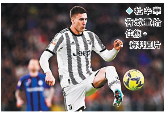
◆杜辛華荷域重拾佳態。

而昨日凌晨AC米蘭在派上了多名副選球員之下，主場照樣以4:1輕取卡利亞里，出線8強，其中盧卡祖域梅開二度，第3次替A米上陣的19歲翼鋒查卡查奧爾更收穫在一線隊的首個入球，最後由後備入替的拉菲爾利亞奧埋齊。