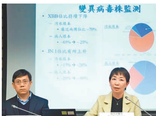
◆張竹君(右)、歐家榮(左)在記者會上呼籲市民提高警覺，應對呼吸道感染疾病上升。

對於香港存在多項病毒株活躍，張竹君建議，盡快接種流感和新冠疫苗，同時除了不適要戴口罩，若身處人多擠迫的室內環境或通風