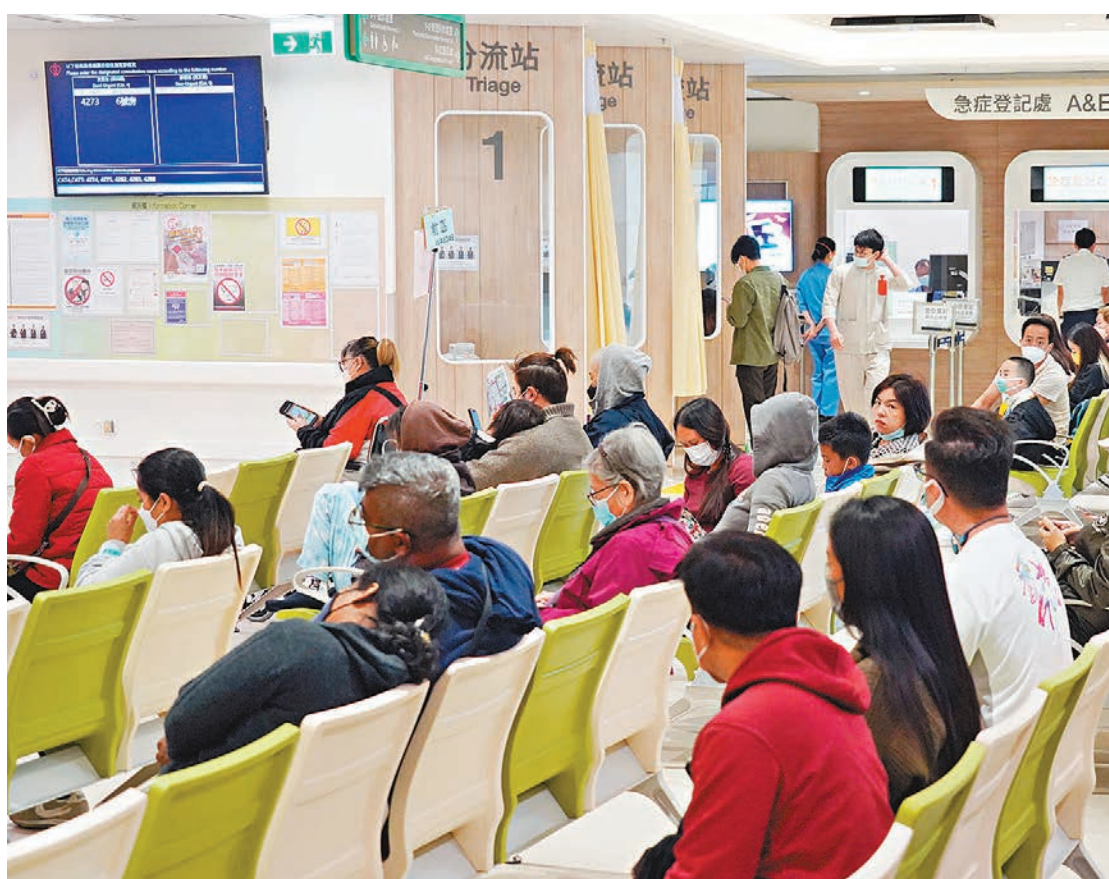
◆香港特區政府衛生署衛生防護中心預料香港下周將進入流感高峰期，呼籲高風險人士和市民盡早接種相關疫苗。圖為市民到公立醫院急症室候診。