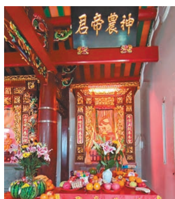
◆圖為「神農帝君」神位。

東華醫院自1872年成立開幕，即崇祀公認為中醫藥發明者的藥王神農氏，神位供奉於醫院大堂中央，代表贈醫施藥、拯救病苦的精神。廣華醫院1911年成立，也將神農氏的牌位供奉於醫院的東華三院文物館內，農曆四月廿八日定為神農誕。另外香港中藥聯商會都有供奉神農大帝，每年都有誕期祭祀。