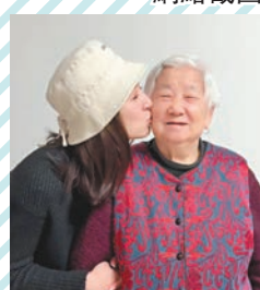
◆高海寧不停親吻外婆臉龐。網絡截圖

香港文匯報訊 高海寧(Gao Ling)憑在《新聞女王》飾演許詩晴一角而人氣急升,商演工作密密接,不過孝順的她還是將家人放首位,踏入新的一年她先回南京探望外婆。