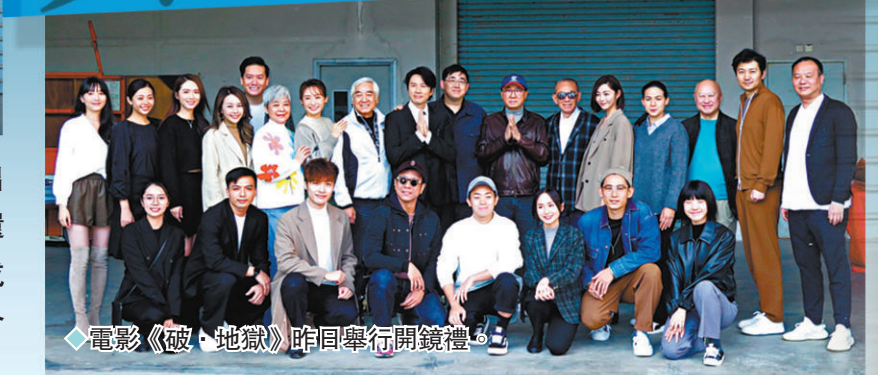
◆電影《破·地獄》昨日舉行開鏡禮。