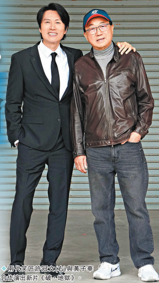
◆兩代笑匠許冠文(右)與黃子華合作演出新片《破·地獄》。

香港文匯報訊(記者阿祖)由兩代笑匠許冠文與黃子華合作演出的電影《破·地獄》昨日舉行開鏡禮,拜神儀式上,除二人外,還有演員衛詩雅、周家怡、朱栢康、秦沛、金燕玲及英皇老闆楊受成等出席,而許冠文跟黃子華是繼32年前電影《神算》後再攜手合作,子華感覺是個奇跡,更相信許冠文能再創高峰。