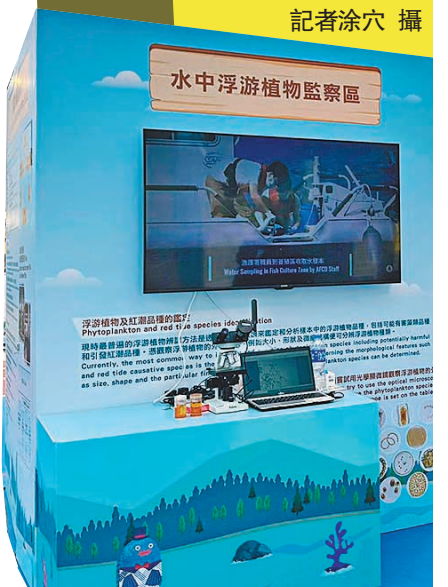
◆水中浮游植物監察區