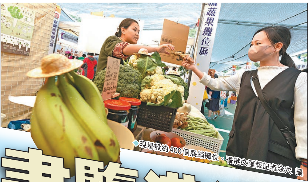
現場設約400個展銷攤位。