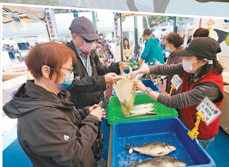
◆街坊林先生與妻子。