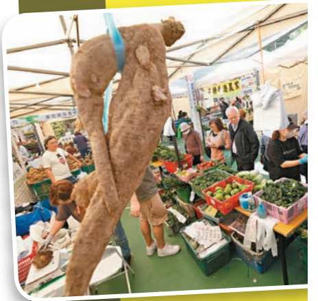
◆市民大讚「薑又靚菜又靚」。

嘉年華另設本地美食及有機或健康食品攤位、漁農業展覽、拍照區等，更有虛擬實境技術(VR)讓市民體驗現代化農業科技，包括全環控水耕技術、農場機械化等。現場亦設表演活動，包括歌手獻唱、文藝表演，以及米芝蓮三星餐廳主廚烹飪示範。