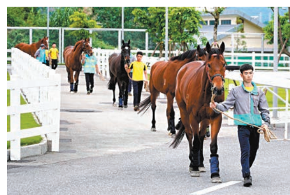
◆ 經過從化馬場海關監管區的一系列檢查後，香港賽馬抵達廣州從化馬場。 資料圖片

《意見》提出，要增強北部山區產業發展新動能，推動各區鎮聚焦綠色蔬菜、嶺南佳果等現代農業，因地制宜發展特色產業集群，延伸產業鏈、貫通供應鏈、提升價值鏈，打造增城遲菜心、絲苗米等特色鮮明的區域公共品牌，積極參與粵港澳大灣區「菜籃子」工程，並基於此發展培育壯大北部山區消費新業態。同時，依託北部山區豐富優質的生態資源，構建多元化生態文旅產品體系，着力打造「灣區生態花園」區域旅遊品牌，引導各鎮旅遊業差異化發展和景區提檔升