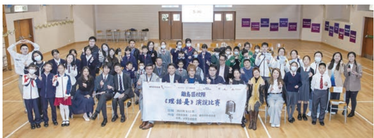
◆ 參賽者於早前舉行的「理·話·是」演說比賽現場與嘉賓合照。

由離島區校長會主辦，東涌安全健康城市、大嶼山區少年警訊合辦，離島民政事務處資助，香港迪士尼樂園贊助，香港明愛、東莞暨大港澳子弟學校全力支持的「理·話·是」演說比賽頒獎典禮，將於1月20日在中環中心地下H6 Conet.舉行。為隆重其事，大會選得