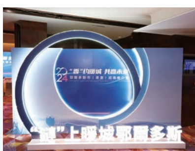
▲▲ 2024鄂爾多斯市(港澳)招商推介會圓滿舉行，透過全方位展示區內各項優勢對接發展新機遇。