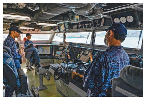
◆日護衛艦「能代號」減少船員數目。網上圖片

韓國也面對同樣難題，祥明大學國家安全學教授崔秉玉表示，作為全球出生率最低、韓國在應對日益緊張的西太平洋地區新威脅時，可能很快會發現沒有足夠軍隊，「人口問題可能是韓國現時最大的敵人，以我們目前的出生率，縮減軍隊規模將無可避免。」