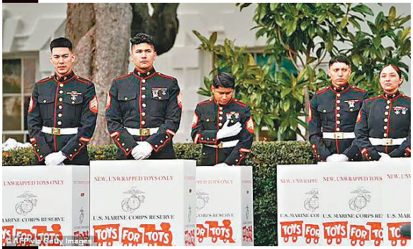
◆美國海軍陸戰隊成員在白宮南廊出席儀式。

美軍事務網站Military報道，美軍近年不斷提供徵兵誘因，包括為新兵簡化入籍程序，讓他們在完成基本軍事訓練期間，即可成為美國公民。各大軍種為徵兵想盡辦法，陸軍選擇恢復1980年代徵兵熱潮期間的口號，空軍也放寬對新兵紋身及藥物測試的相關要求，海軍還推出創紀錄的入伍補貼，最高可達每人14萬美元（約109萬港元），但所有方法都收效甚微。