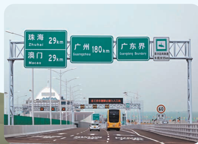
◆港人北上和外遊人數急升,通關後日均超過16萬人次北上消費。 資料圖片