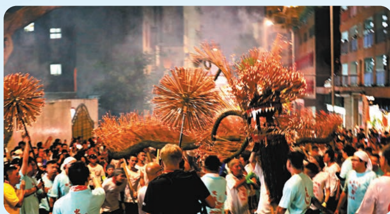
◆去年9月,中秋大坑舞火龍。 資料圖片