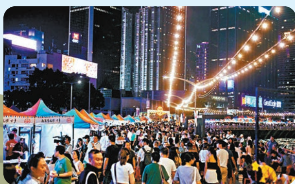
◆去年9月開展的「香港夜繽紛」活動,涵蓋娛樂、藝術、文化、消費等主題。 資料圖片