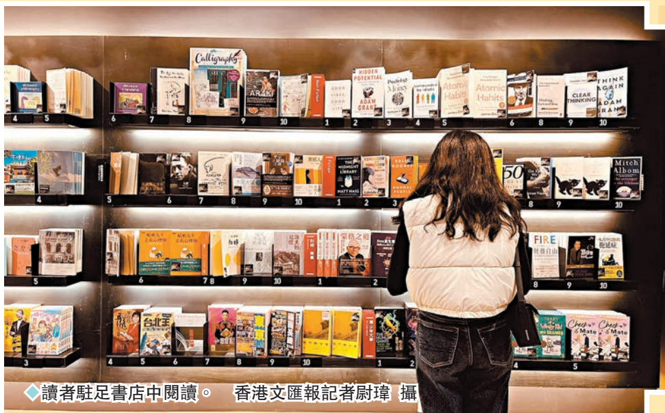
讀者駐足書店中閱讀。