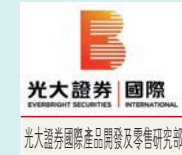
光大證券國際 光大證券國際產品及零售部

不少投資者對定期派息的投資產品感興趣，當中包括定期派息的基金。投資派息基金可以享受定期收息的好處，其中亞太區高息股基金的特點多是每月派息，彈性較高，若作退休儲備、抗通脹及收息途徑，便可自製穩定收入。