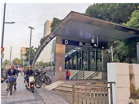
◆ 深圳地鐵「登良站」。

東端的科苑南路，起始於深圳市高新技術產業園，沿深圳灣蜿蜒向南，在一幢幢特色鮮明的高樓大廈間穿梭。騰訊、阿里巴巴等超級互聯網企業入駐，深圳灣總部基地、深圳灣體育中心、深圳灣文化廣場、深圳人才公園等現代化配套設施相連