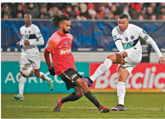
◆法國第6級別聯賽球隊雷維爾,喜獲與麥巴比交手的機會。

然而,麥巴比在PSG的時間傳出再次進入倒數階段,據法媒報道,今夏約滿的麥巴比已經與皇家馬德里達成協議,在今夏過檔該支西甲班霸。