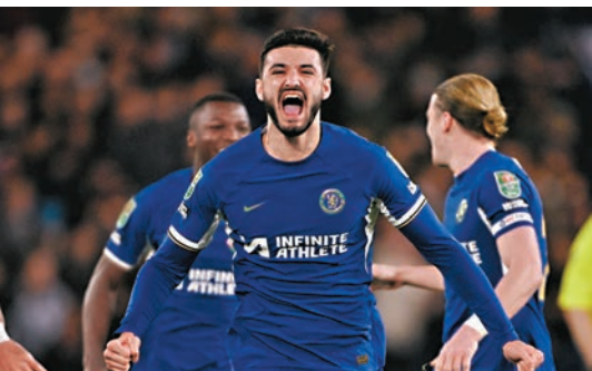
◆車路士年輕射手布查剛對足總盃取得入球。