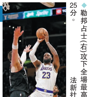
◆勒邦占士(右)攻下全場最高25分。