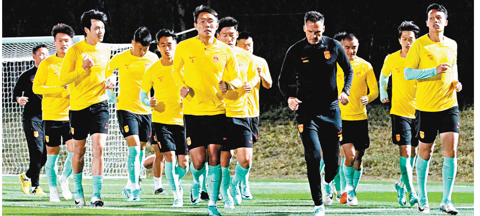
◆國足抵多哈後進行首課訓練。

卡塔爾男足亞洲盃將於當地時間1月12日至2月10日舉行，國足與卡塔爾、塔吉克斯坦和黎巴嫩隊同被分在A組。1月13日，國足將在首場比賽中對陣塔吉克斯坦，17日對陣黎巴嫩，22日對陣卡塔爾。