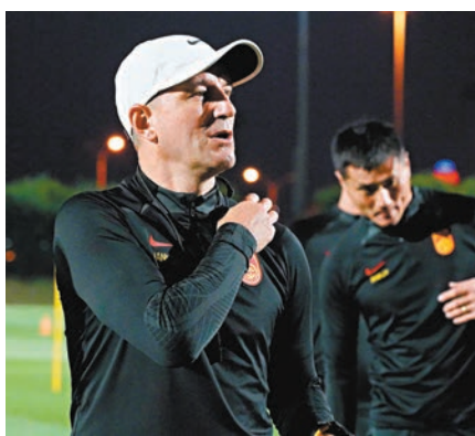
◆國足主帥揚科維奇。

在抵多哈前，國足在阿聯酋阿布扎比進行了為期三周的集訓，與阿曼、中國香港以及兩支阿聯酋當地俱樂部進行了四場熱身賽，戰績為兩勝兩負。其中，國足分別以0:2和1:2不敵阿曼與中國香港隊。