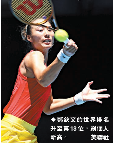
◆鄭欽文的世界排名升至第13位，創個人新高。

香港文匯報訊(記者 陳曉莉)WTA(女子網球選手協會)昨日公布最新一期世界排名，多位中國「金花」排名有所提升，共有7位中國內地選手躋身前100。其中，鄭欽文刷新個人排名新高，上升至第13位。波蘭名將施施蒂依穩居世界第一，她的世界第一周數累計已達85周。