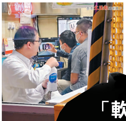
◆ 警方人員在管理處拍攝工廈監控器畫面取證。