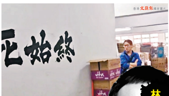
◆ 涉案公司牆上印有「誓死始終」標語。

創新科技署及秘書處會繼續與警方緊密合作。由於個案已進入司法程序，署方不便作進一步評論。