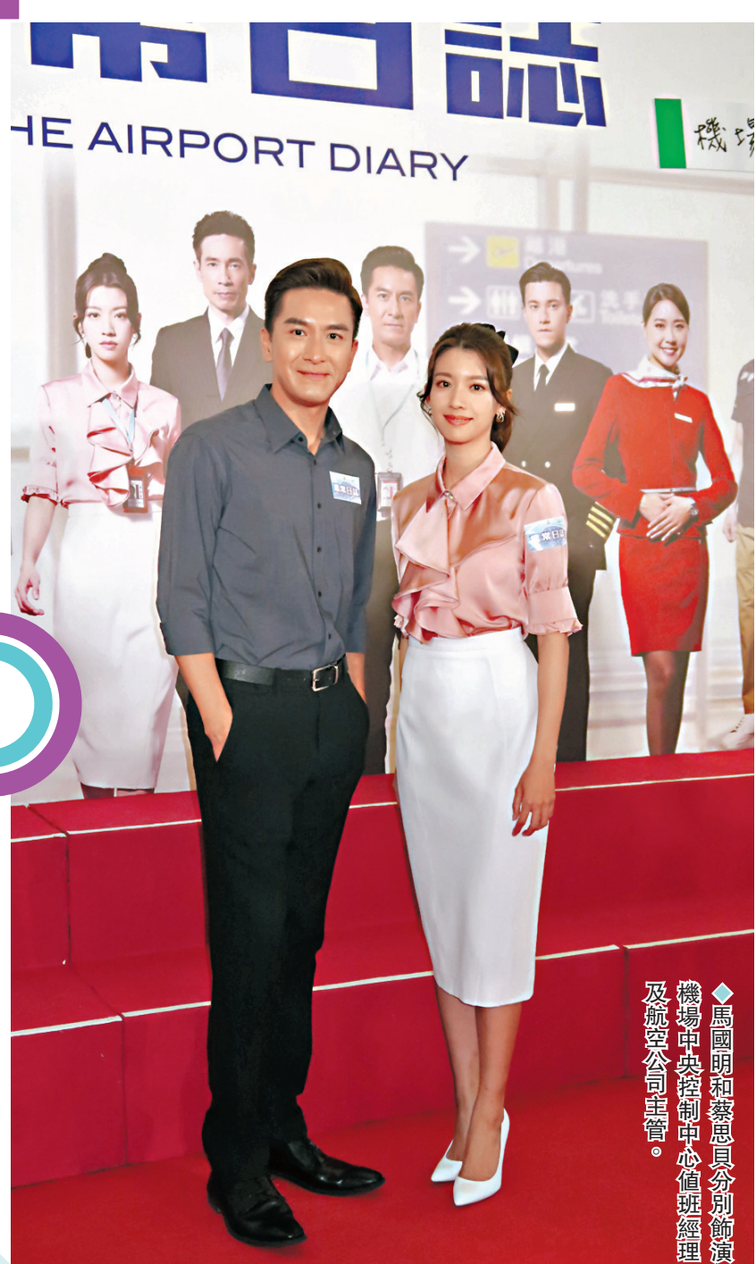
◆《飛常日誌》劇組昨日在機場舉行宣傳活動。