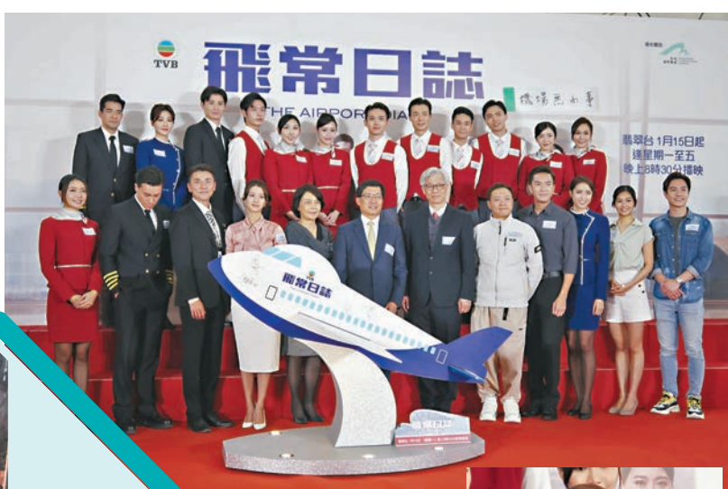
◆馬國明和蔡思貝分別飾演機場中央控制中心值班經理及航空公司主管。